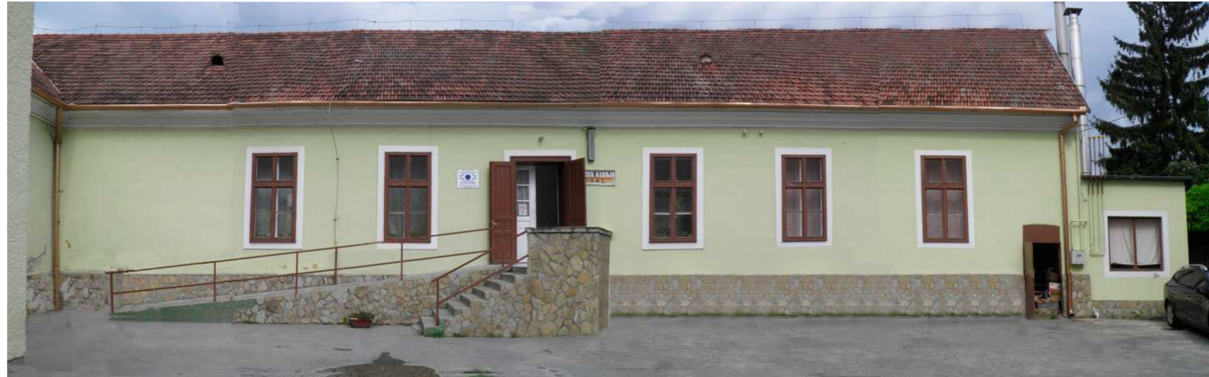
UDVARI NYUGATI HOMLOKZAT